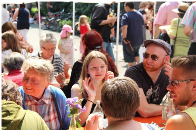
Bild: Zufriedene Gesichter beim Sommergemeindefest 2013. Das Wetter spielte mit, das Essen hat gemundet, die Stimmung war rundum harmonisch.