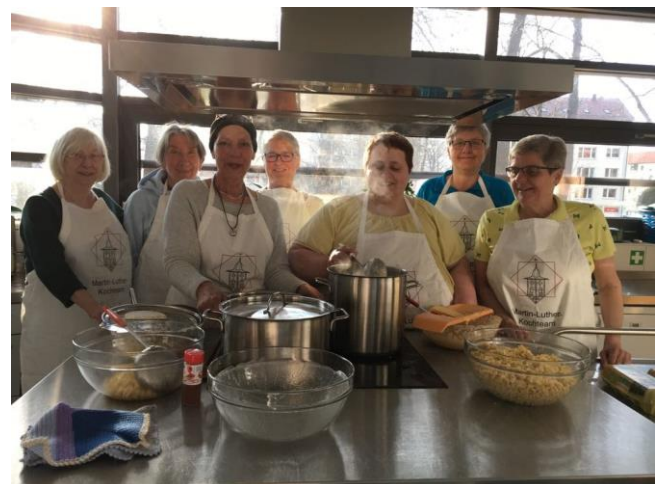
Bild: beim letzten Gemeindegessen wurden Spätzle gemacht, handwerklich perfekt mit Ei, Mehl und Salz. Die neue Dunst-abzugshaube musste richtig viel Dampf abziehen. Die Köchinnen hatten nagelneue Schützen an, darauf der Kirchturm der Martin-Luther-Kirche! Spaß hat es gemacht, viel Spaß.