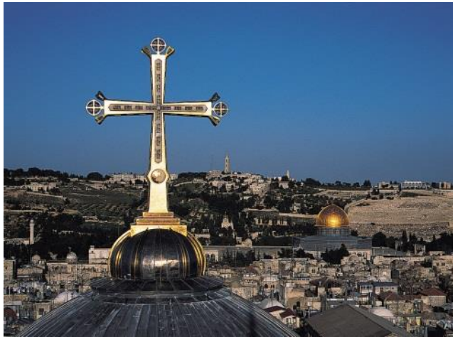
Bild: Das leuchtende Kreuz über der Grabeskirche von Jerusalem, die zugleich den Hügel beherbergt, den die Bibel unter dem Namen „Golgatha“ kennt. Jesus wurde dort von den Römern gekreuzigt.

Am Montag, 12.11., 15:00 Uhr im Rupert-Mayer-Haus, Neunkirchenweg 63, Kuhberg. „Heiliger Ort und zugleich Streitpunkt: die Grabeskirche in Jerusalem“