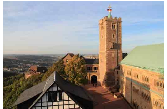
Bild: Die Wartburg, einst Heimat von Elisabeth und von Martin

Ein Gemeindeglied meinte neulich: bei dem Namen kann man sich das Eigenschaftswort „evangelisch“ glatt sparen! Natürlich kann man das, obwohl Luther (*1483) bis zur Reformation (1517) Mönch und damit katholisch war. Das waren immerhin 34 Lebensjahre! Martin Luther wollte auch keine neue Kirche eröffnen, sondern er wusste ja aus der Heiligen Schrift, dass die wahre Kirche eigentlich nur der eine „Leib Christi“ (Johannes 17 und 1. Korinther 12) sein kann, nicht die „Kirchen“, erst recht keine Splittergruppen und Sekten. Eine „lutherische“ Kirche hat er selbst sogar abgelehnt.